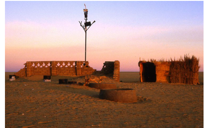
arbre du ténéré (niger) -