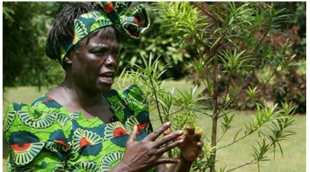
wangari muta maathai

im jahr 1977 rief wangari muta maathai („mama miti“ – kiswaheli für mutter der bäume) das aufforstungsprojekt „green belt movement“ ins leben _ hieraus wurde eine panafrikanische bewegung , die mittlerweile in 13 ländern aktiv ist , etwa j600 baumschulen gründete und bis 1993 zum schutz vor erosion 30 millionen bäume neu pflanzte _ 2004 erhielt sie , die in zielstrebigem förderung von afrikanischer frauenpolitik die beste vorbeugung gegen wasser- und andere umweltschäden sah , als erste afrikanische frau den friedensnobelpreis _